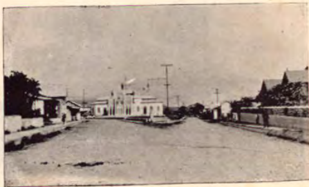
Fachada actual de la Iglesia de los Angeles

Cartago, que había tenido la su premaxia en la Provincia durante dos siglos y medio, se vió puesta en se-