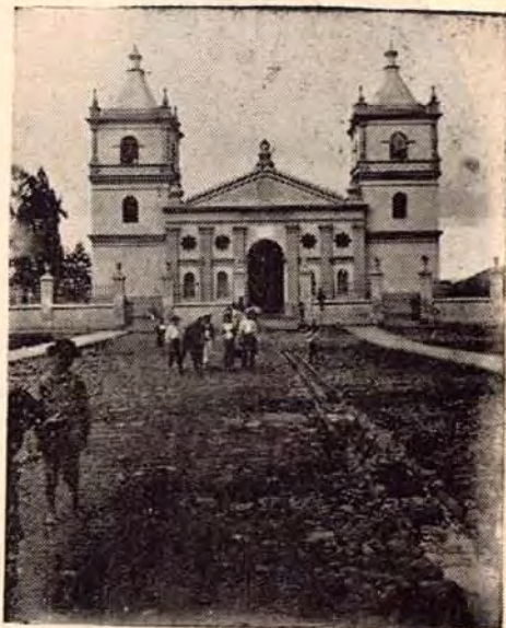
La Iglesia de los Angeles antes del Terremoto de 1910

En 1681 se vió amenazada por los piratas, que fueron rechazados por el gobernador Sáenz Vázquez; todas estas calamidades y sumados los terremotos de 1723 y 1741, hacían que la ciudad avanzara poco y sus habitantes fueran pobres.