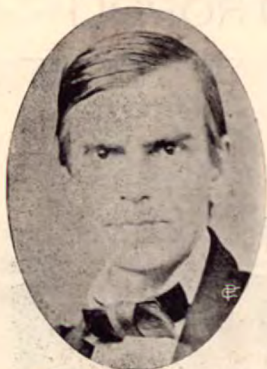
DON JULIAN VOLIO el mejor orador de su época