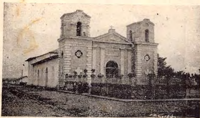
Iglesia de San Francisco (RR. PP. Capuchinos) antes del Terremoto de 1910

Costa Rica formaba entonces la Provincia más pequeña y atrasada del Reino de Guatemala, y sus habitantes, poco más o menos 50.000, se encontraban miserablemente aislados del resto de la civilización. Las industrias eran pocas y muy rudimentarias, y se vivía pobremente de los productos agrícolas. Así se encontraba la Provincia cuando las primeras ideas de independencia vinieron a cambiar la faz de nuestra vida política; la índole pacífica y ordenada de los habitantes, que habían sido gobernados por hombres excelentes, como Don Tomás de Acosta y don Juan de Dios